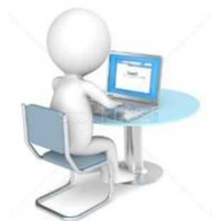
ГРАФИК ПРОХОЖДЕНИЯ АТТЕСТАЦИИ ПЕДАГОГИЧЕСКИМИ РАБОТНИКАМИ